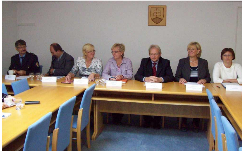
Tlačová konferencia na Obvodnom úrade Kežmarok