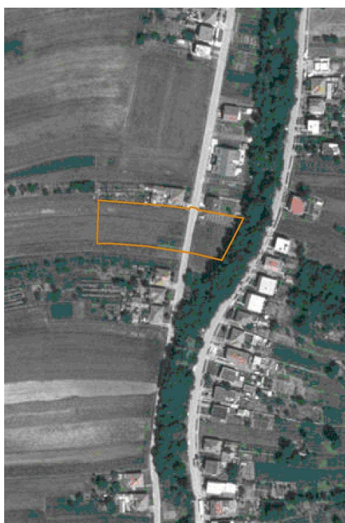
Časť obvodu č.1