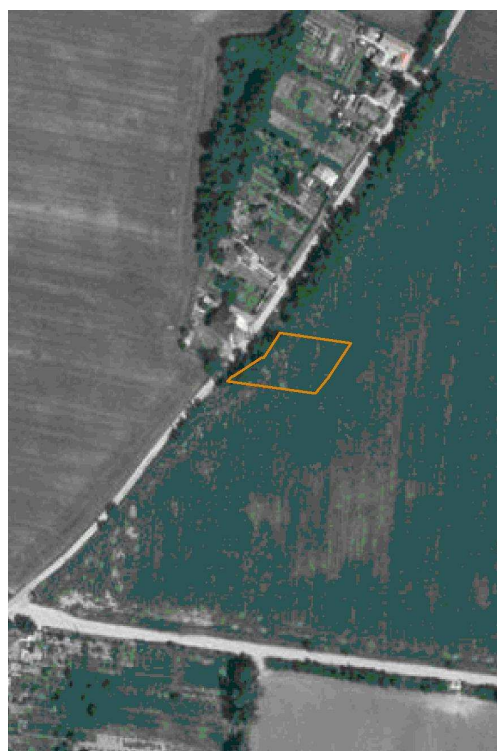
Časť obvodu č.2